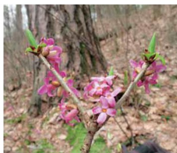
Волчье лыко обыкновенное