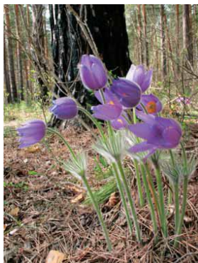
Прострел раскрытый (Сон-трава)